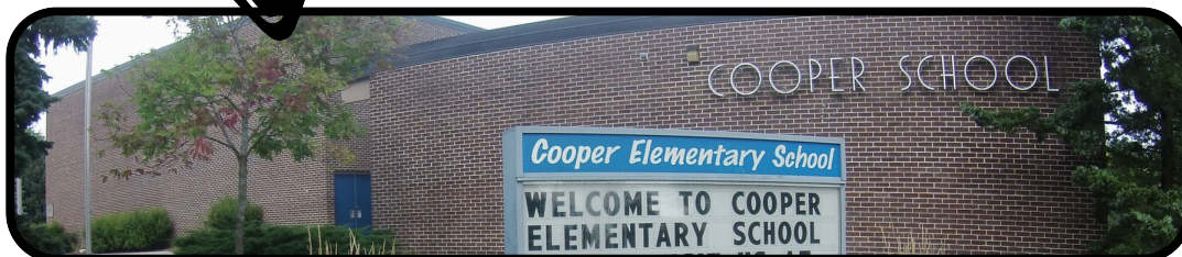
Escuela Cooper Montessori

Los recorridos brindan a las familias la oportunidad de conocer a miembros del personal, ver áreas comunes y aprender más sobre lo que ofrece la programación Montessori.